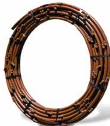
Tubo Gotejador QF