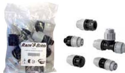
Conexões Compatíveis com XQF